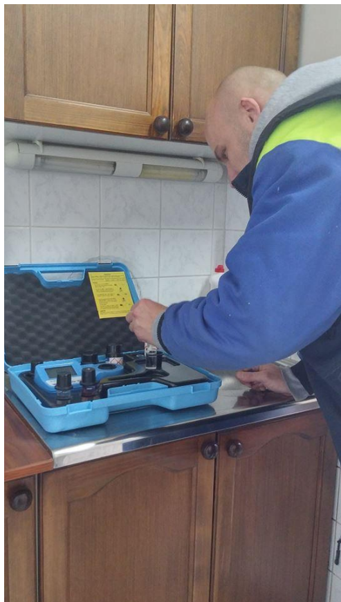
Obr. 3: Měření úrovně chloru