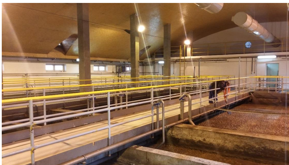
Obr. 1: Čistírna odpadních vod Úvaly

Během posledního kvartálu roku 2015 a fakticky prvního kvartálu činnosti TSÚ byla reálně vykonávána pouze doplňková činnost, kam spadá provozování vodovodů a kanalizace. Ve spolupráci s Městem Úvaly a poradenskou společností Vodohospodářský rozvoj a výstavba, a.s. byl připraven nový Provozní řád vodovodů, dále byly připraveny všechny další podklady pro zahájení činnosti správy vodohospodářské infrastruktury, byla provedena počáteční údržba sítě spočívající zejména ve vyčištění čistírny odpadních vod, údržba a úklid vodojemů atd. Byly připraveny rámcové smlouvy s dodavateli jak služeb, tak i komodit typu chemických látek určených pro spotřebu na ČOV, nebo pro údržbu a obnovu vodovodní sítě (šoupata, hrnky, navrtávací pasy atd.).