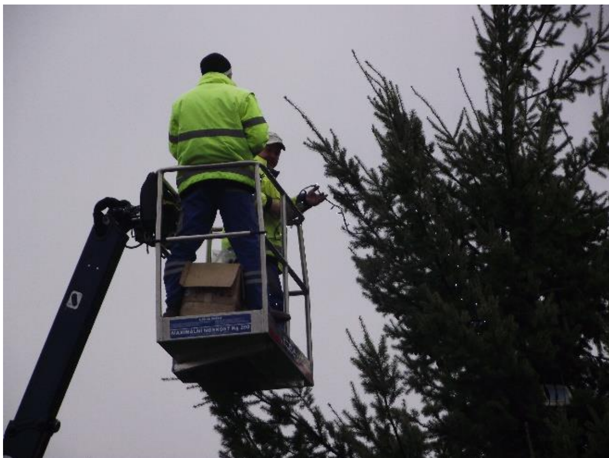
Obr. 4: Instalace vánočního osvětlení na vánoční strom