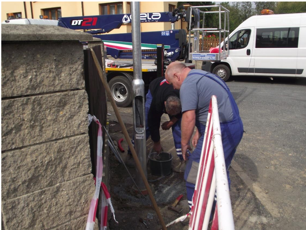
Obr. 1: Realizace VO – ul. Guth-Jarkovského

Jednotka věnující se správě VO zahrnuje 2 zaměstnance, kteří však v rámci své činnosti vykonávají i jiné práce pro úsek údržby města. Naopak např. při údržbě veřejného osvětlení (zednické práce při výměně sloupů atd.) jsou využiti jiní zaměstnanci TSÚ. Při vyhodnocení uplynulého devítiměsíčního období, kdy se TSÚ věnovaly správě VO, tak lze říci, že celkový počet úvazku potřebných na VO je 1,0.