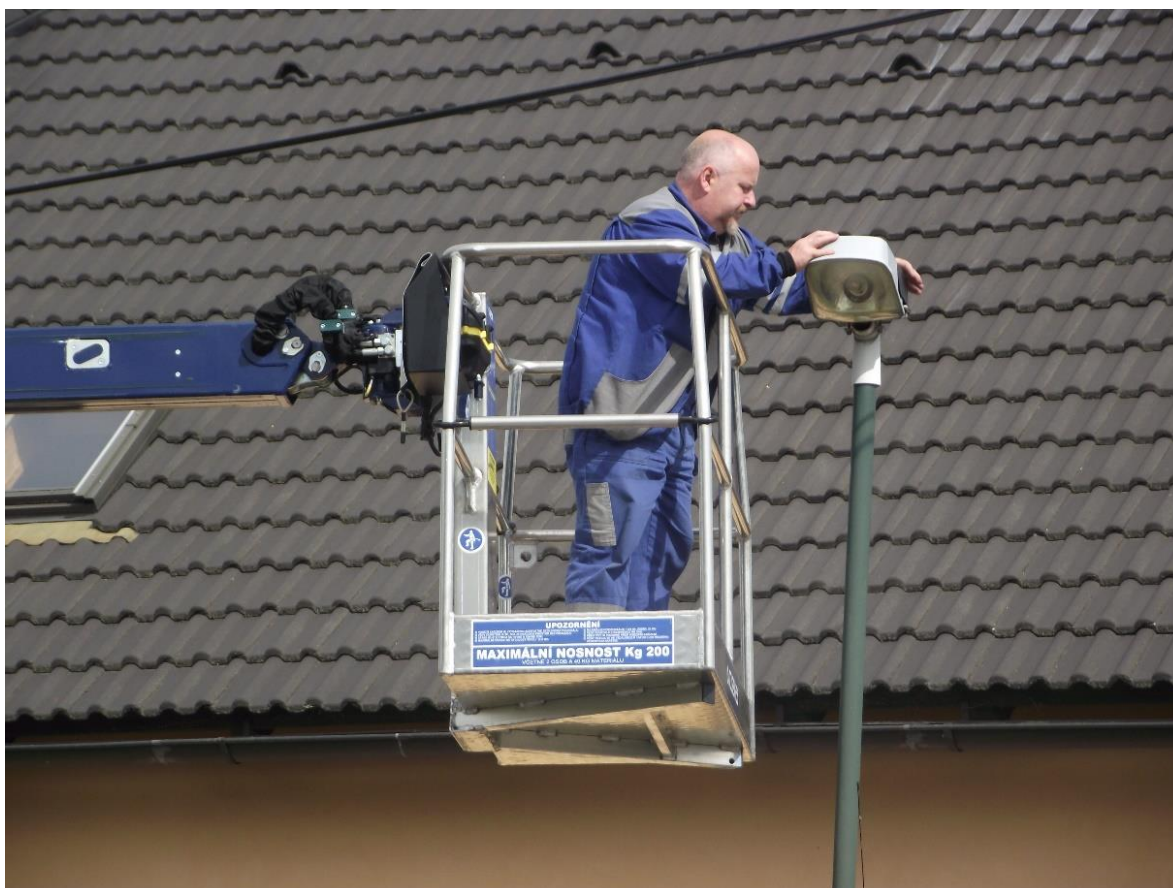
Obr. 2: Operativní údržba VO