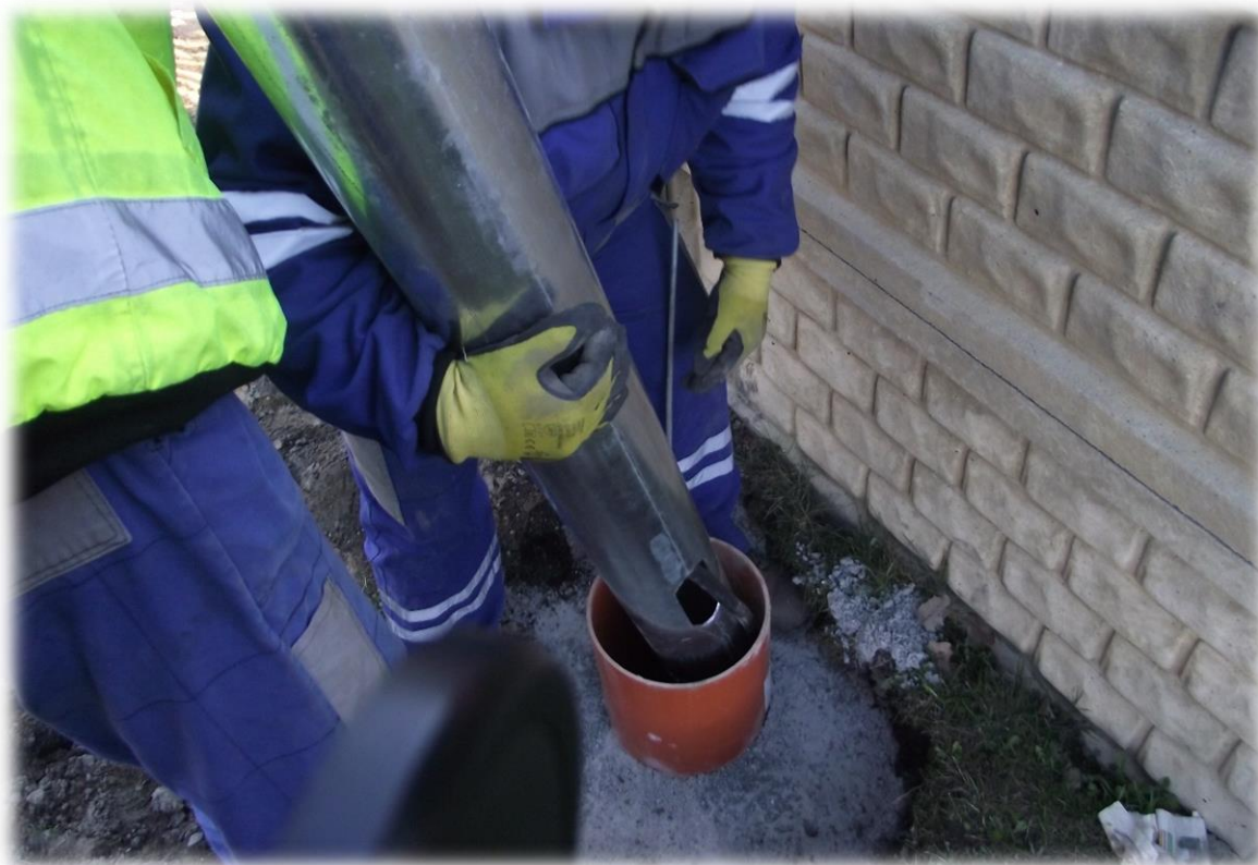
Obr. 1: Realizace VO – Pařezina

Začátkem roku 2018 posádka VO zahrnovala 2 zaměstnance, v polovině roku byl tento tým oslaben z důvodu odchodu jednoho zaměstnancem za finančně zajímavější pracovní nabídkou, tento stav byl do konce roku nezměněn. Od poloviny března do konce prosince bylo průběžně budováno nové veřejné osvětlení, elektrikáři byli 100% využiti právě na tyto práce, ve zbývajícím čase prováděli drobné elektrikářské práce na objektech města a věnovali se opravám a údržbě VO. Při budování nového VO (zednické práce při výměně sloupů atd.) byli využiti i jiní zaměstnanci TSMÚ – při výstavbě osvětlení v Pařezině a ul. Želivského byli do těchto prací zapojeni další 2-4 zaměstnanci, v závislosti na charakteru práce. Listopad 2018 se nesl v duchu Vánoc, úkolem TSMÚ bylo jako každý rok vánočně nazdobit město a připravit adventní sobotu.