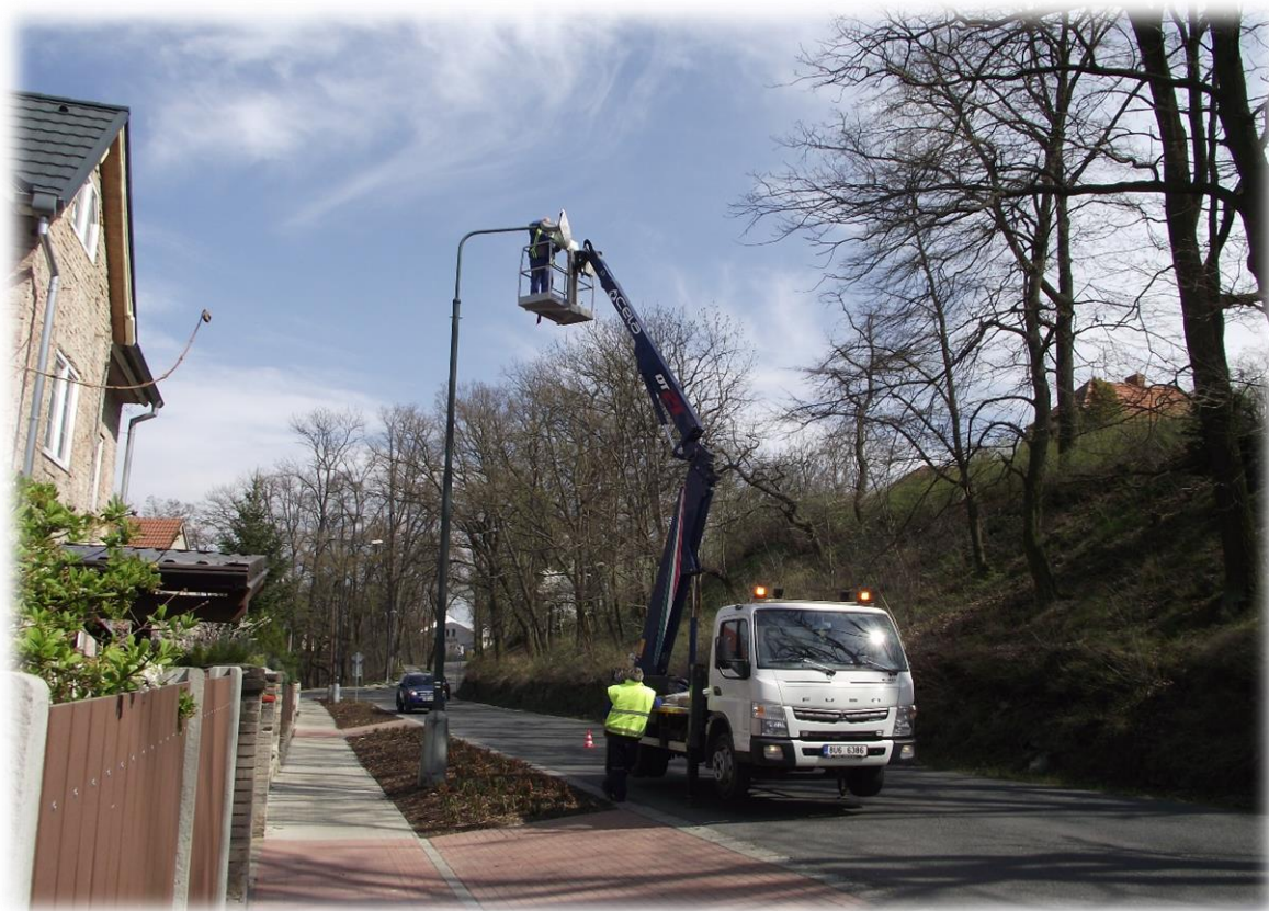
Obr. 2: Operativní údržba VO